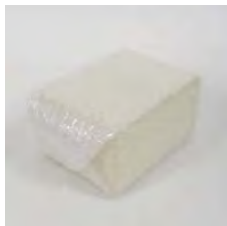
※プチプチ(緩衝材)で包む