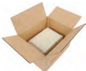
※ダンボールの中央に入れる