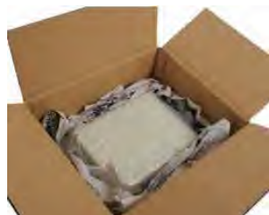
※周囲に新聞紙等の緩衝材をなるべく隙間のないように詰める