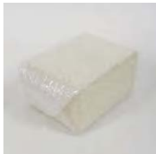
※プチプチ(緩衝材)で包む