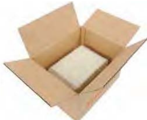
※ダンボールの中央に入れる