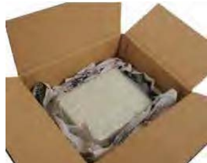
※周囲に新聞紙等の緩衝材をなるべく隙間のないように詰める